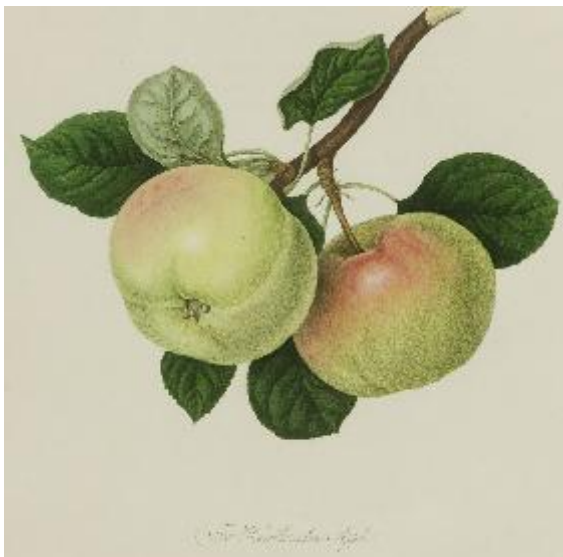
Pomona Londinensis 1818, William HOOKER. Vol.1.

ORIGINE : Village d'Ecosse près d'Edimbourg du nom du fruit, avant 1780. Cultivée vers 1790 à Londres dans les pépinières de Brompton-Park. Vendu chez Leroy à Angers avant 1873. Conservé à Brogdale « the Book of Apples », 1993, p.217.